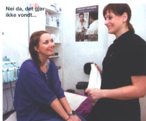
Nei da, det gjør ikke vondt...